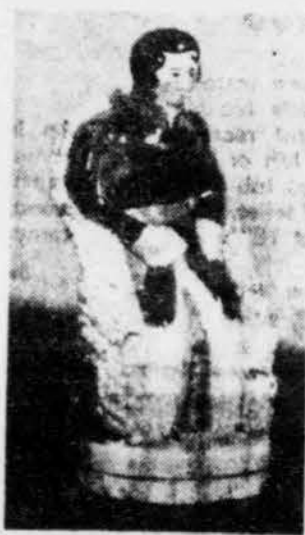
CHIMNEY KING: Staffordshire figures, to be used as ornaments on the "chimney-piece" (or mantelpiece) were sold at the Gerrard auction in Montreal in 1828. Such a figure is this little Staffordshire statue of King George IV.

Garrison officers from overseas, whose term of duty in Canada was over, would frequently put their household goods into the hands of an auctioneer. Thus we find the firm of Fraser & Taylor, Montreal auctioneers of 1815, advertising in June of that year a sale