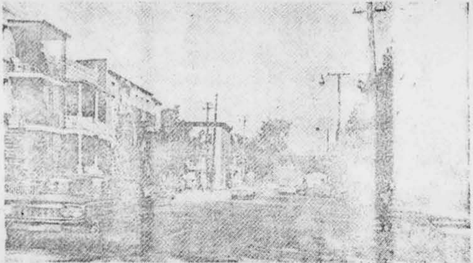
Cette photo fut prise quelques jours après la fin des travaux de construction de conduites souterraines de fils électriques dans la rue Viau.

Un plan initial, qui prévoyait l'élargissement de la rue Viau, a été abandonné, car le coût de l'expropriation des immeubles nécessaires aurait été trop élevé. La construction de conduites souterraines d'électricité, au