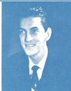
LUCIEN HÉTU (Disque RCA Victor)