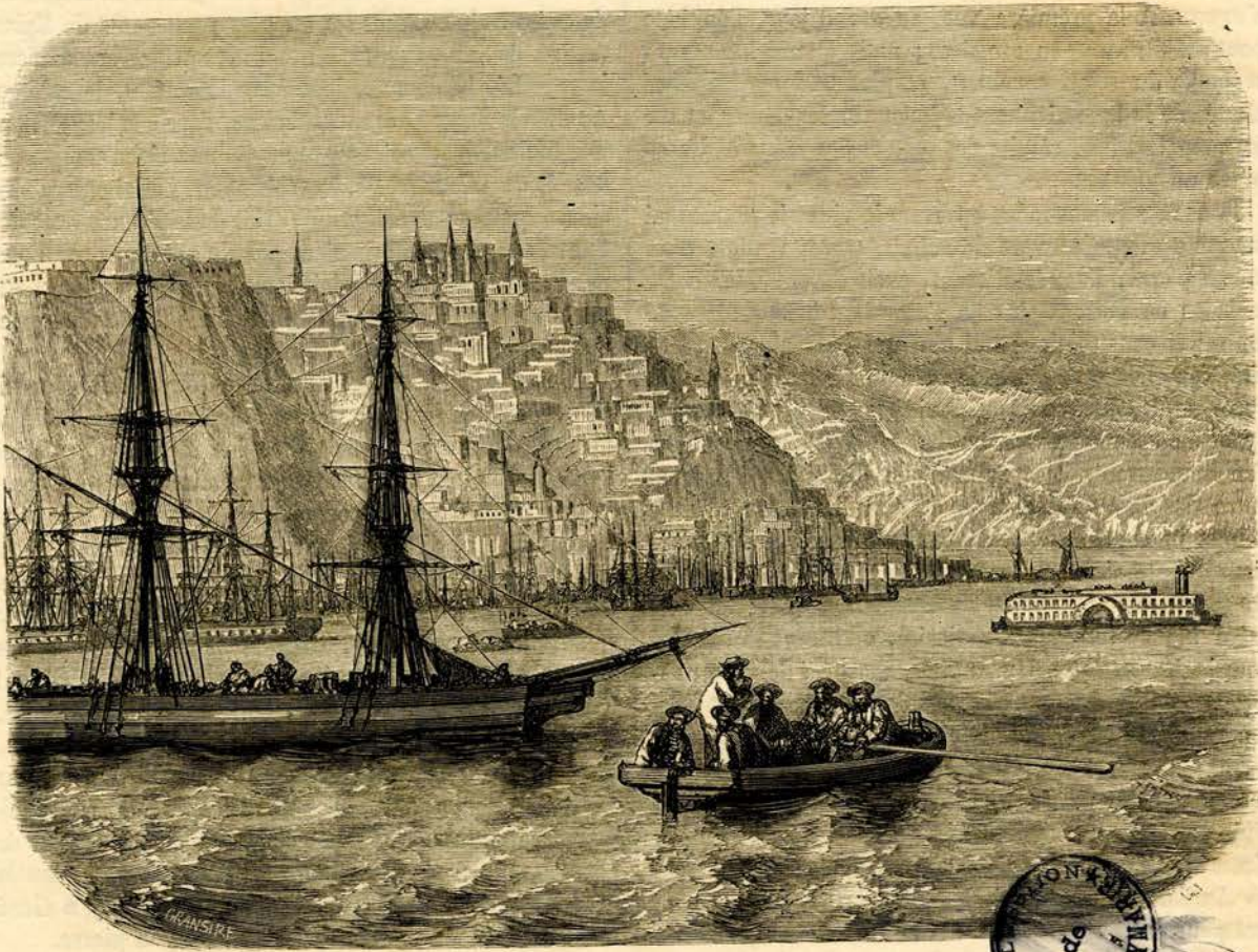
Vue de Québec (voy. p. 254). — Dessin de Grandsire d'après M. Deville.

A la frontière anglaise, une voie ferrée fait suite à la voie d'eau dans la direction de Montréal; un convoi nous y attendait. Le service du chemin de fer avait été interrompu depuis quelques jours par le feu qui avait éclaté dans les forêts voisines. La pluie, qui nous avait assaillis, avait aussi éteint l'incendie, et nous avons pu