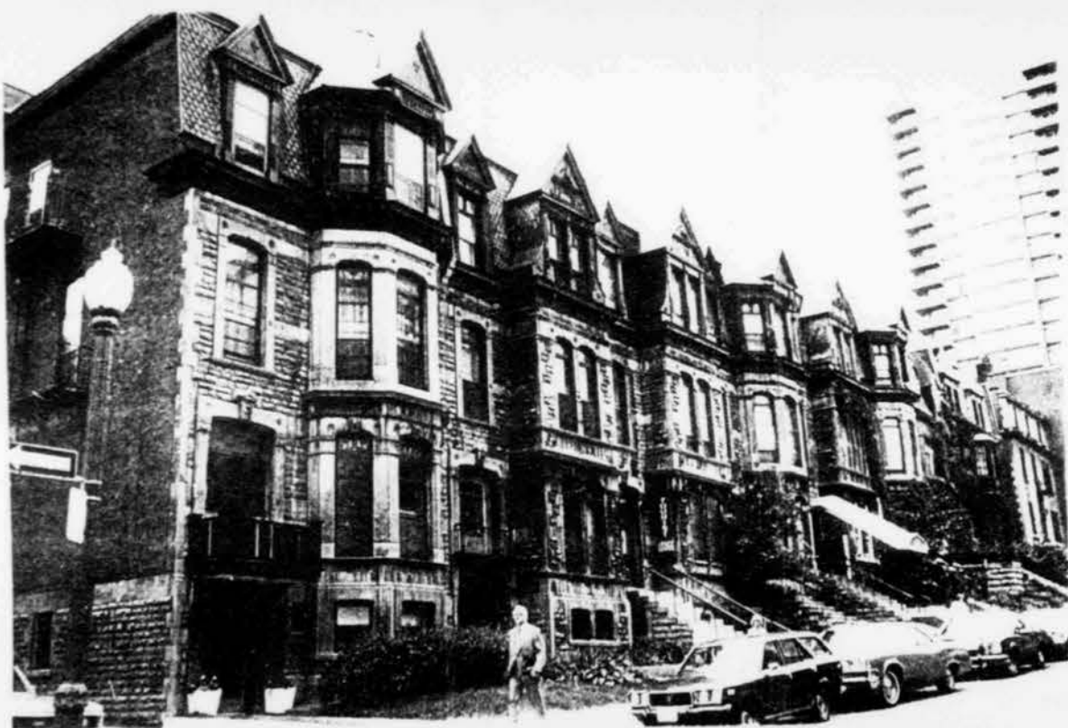
Ensemble 3414 à 3442 Stanley, entre Sherbrooke & McGregor