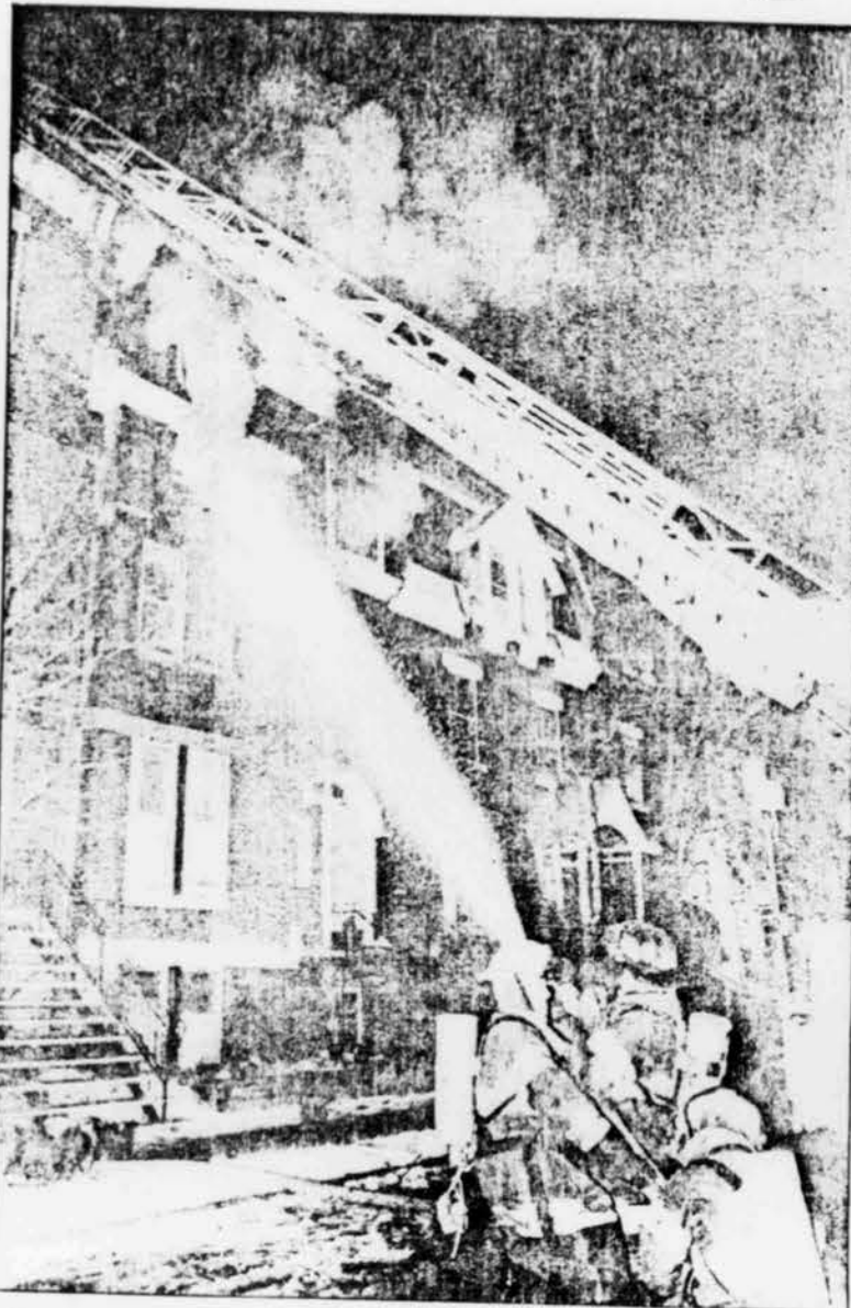
Rough night: Firemen pour water into the blaze last night in a row of rooming houses.

Firefighters fought the blaze with hoses from the inside for more than 90 minutes before attacking the fire from the outside, with a huge "snorkel" and ladder apparatus.