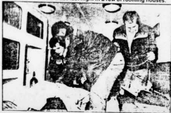
Urgent situation: Medics hurried to aid the burned man but he was beyond help, so badly disfigured his age couldn't be estimated.